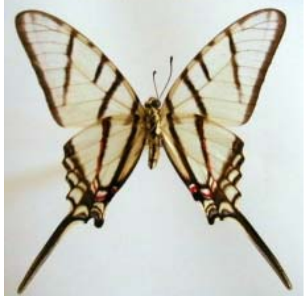
Vistas dorsal y ventral : Nicaragua : León : Río Pochote, 22-IV-94, col. J.M. Maes & R. Brabant.