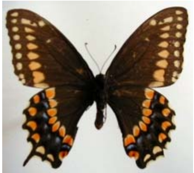
Vistas dorsal y ventral : Nicaragua : Matagalpa : Fuente Pura, 1-I-94, col. E. van den Berghe