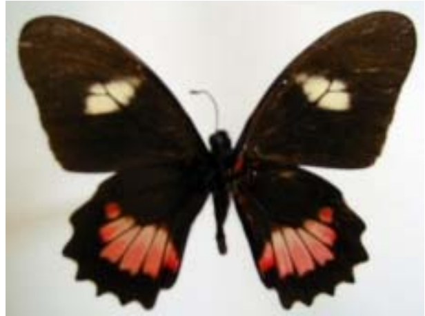
Hembra de la forma branchus en vistas dorsal y ventral : Nicaragua : Jinotega : Río Bocay : Grutas de Tunawalan, 6-IX-97, col. J.M. Maes & B. Hernández.