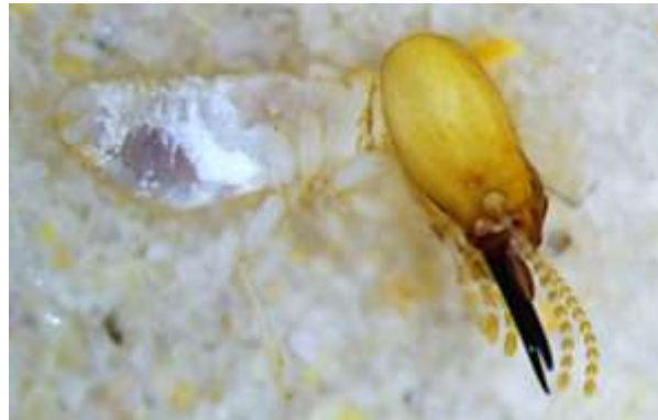
Figura 1. Habitus lateral en cámara de arena del soldado de Microcerotermes sp.

Mandíbulas simétricas, con los márgenes internos serrados.