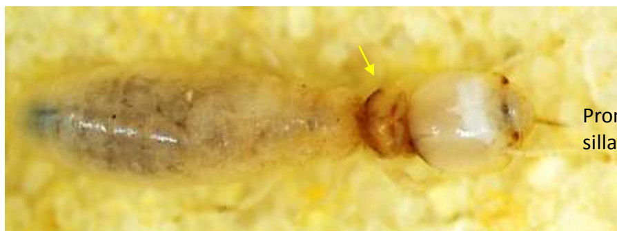
Figura 2. Detalle dorsal de cabeza en cámara de arena del soldado de Microcerotermes sp.