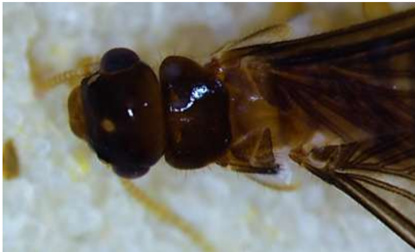
Figura 5. Detalle dorsal en cámara de arena de la cabeza y pronoto del imago de Microcerotermes sp.