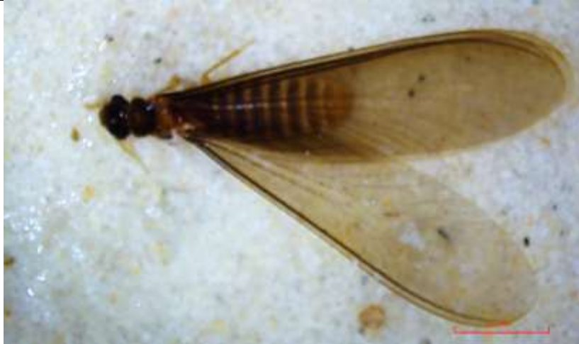
Figura 4. Habitus dorsal en cámara de arena del imago de Microcerotermes sp.