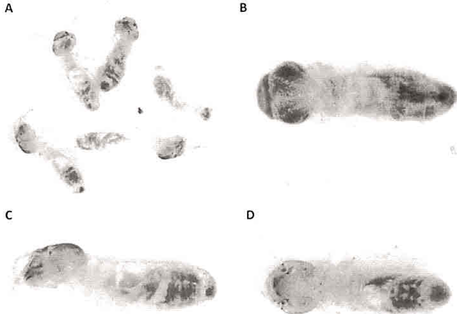
Figura 1. Isoptera. Obreras. A. Vista general de los especímenes recibidos en la muestra. B. Vista dorsal. C. Vista lateral. D. Vista ventral.