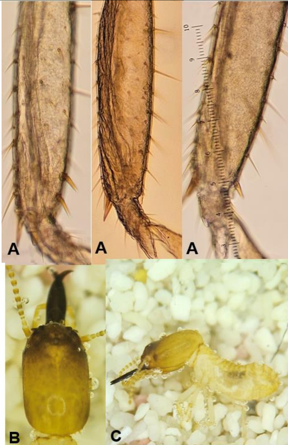
Figura 2. Heterotermes tenuis A. Espuelas tibiales 3:2:2; B. Cabeza y mandíbulas alargada, cabeza con poro frontal pequeño, cabeza con lados paralelos, mandíbulas casi rectas en vista dorsal. C. Vista lateral del espécimen.